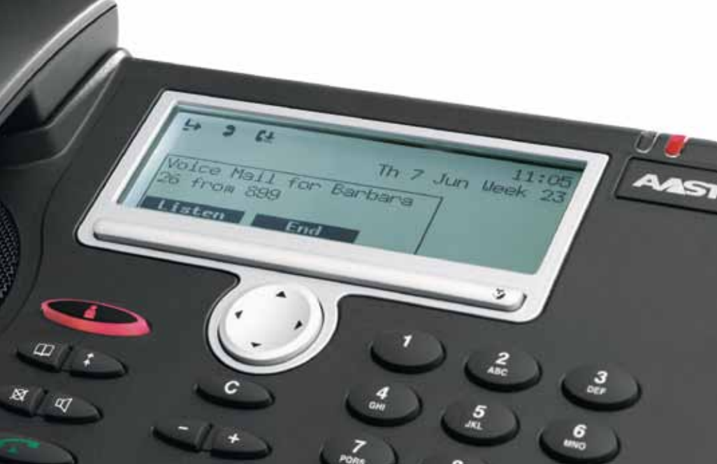
As mensagens de voz que ainda não foram ouvidas aparecem, neste caso, no visor do Aastra 5380ip.