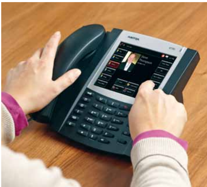
Telefone SIP Aastra 6739i: o grande ecrã táctil a cores é sinónimo de conforto na sua secretária.

Com o Aastra 400, pode gerir facilmente estados de presença individuais e definir vários perfis de gestão de chamadas.