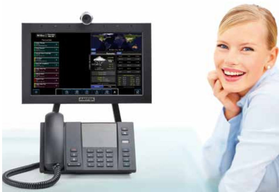
Aastra BluStar 8000i

O ponto de acesso central melhora a eficiência e a produtividade. É possível aceder facilmente a todas as mensagens de voz, faxes e e-mails através do PC ou do telemóvel. Os utilizadores podem então ouvir as mensagens deixadas no seu correio de voz, quando estiverem fora da empresa ou em casa, desde que tenham acesso ao e-mail.