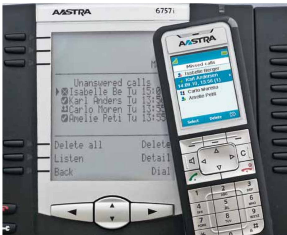
Com o Aastra 400 é você que decide quando quer ou não ser contactado através de qualquer um dos telefones. Com a função «One Number», a pessoa que lhe ligou não sabe se está ou não no escritório.