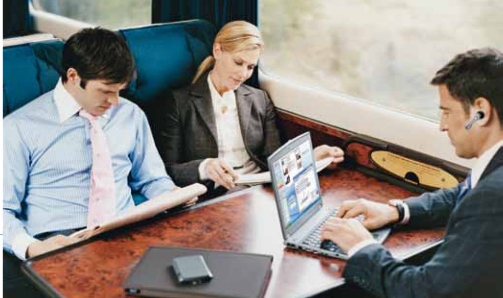
Em movimento mas contactável: com a Aastra é possível.

Com a solução Convergência Fixo-Móvel (FMC), é o utilizador que decide quando e onde quer ser contactado.